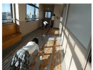
歓声に近づくレンガの壁

1年H組は「The Green Day」という緑日企画を進行中。今年度の錦城祭は一般の人も来場するため、誰にでもわかりやすい内容になるように工夫を凝らしている。また、前回の教室