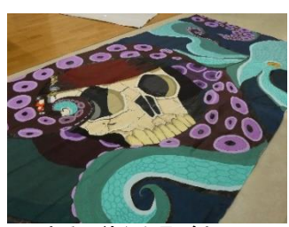
まるで絵から飛び出してきたきそうだ

3年E組は「AmBieN」という人探しと気配斬されたクイズの正解率によって強さが決まる剣で気配斬りを行う。校内で人探しの対象となる人を探し、そこで出たわっぺと、迫力のある絵が製作されていた。夏休み期間に1枚当たり3〜4日間、午前9時から午後5時までか