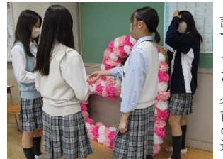
思い出作りの場のために

1年H組は「The Green Day」という緑日企画を進行中。今年度の錦城祭は一般の人も来場するため、誰にでもわかりやすい内容になるように工夫を凝らしている。また、前回の教室