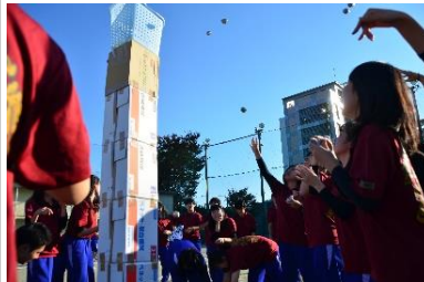
玉入れを楽しむ3年生の女子たち

11月29日(水)のLHRに三年生全クラスで校庭を使い運動会が行われた。競技はアンケートで決定した玉入れと全員リレーの2つだ。男子ハンドつき玉入れは、玉が新聞紙で作られているので軽く、カゴに入れるのに苦戦したが、競技中終始楽しそうに声を響かせていた。結果は一位I組、二位G組、三位J組、四位F組、三位G組となった。