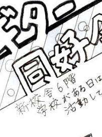
軽音楽部 年度末も盛り上げの春ライブ

春休み中も部活三昧 スキー同好会 春のスキー合宿 修了式が終わり、春休みにデでのフリー滑走もあり、した装飾がされており、来場者の目を惹きました。年度末とあってどのバンドもいつも以上に気合が入っていた。