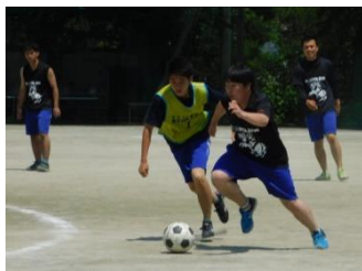
奪われまいと体をぶつけ合う

始めた前半終了間際、再び2Cがシュートを決め0対2で前半は終了した。続く後半、3Aが渾身のプレーで1点を決め、なおも激しい攻防が繰り広げられる。そして試合終盤の意地を見せた3Aが1点を奪取し、ついに2対2の同点に並んだ。そして勝負のPK戦では3人目