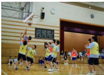
ゴール下でシュートを狙う3D

1A対3Dの試合は、両者一歩も譲らない対決となった。ゴール下を固める1Aに対し、3Dは時間をかけて切り込んでいく。3年生1人に挑む2人で挑むなど1Aは守備を工夫するが、3Dに体格とパワーで押しきられ、第2ピリオド終了時点で8対14とリードされてしまう。