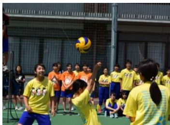
懸命なラリーでボールをつなぐ2B

第2セットは、1Iの強いサーブを打ち返すことができず、一気に5点差をつけられる。追いつこうとするも8対15で1Iがとり、試合は第3