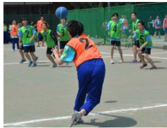
一球一球を全力で投げる2I

後半、流れるようなパスを繋げ、両チーム一歩も譲らなかつたが、2Iの1人ずつつ追いついていく。プレイスタイルに1Hはかなわず、2Iの勝利となった。