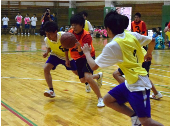
2日目球大、歓声が盛り上がりとともに熱い攻防が繰り広げられる

握る展開が印象的だった。試合が始まってまもなく、2Cが先制点を決める。攻守が目を奪われまいと体をぶつけ合う