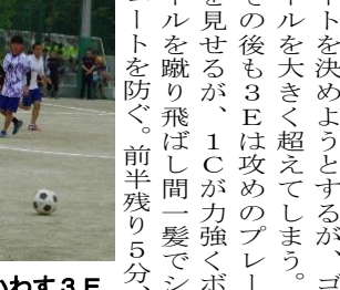
ドリブルで相手をかかわす3E

前半は3Eが積極的にシュートを決めようとするが、ゴールを大きく超えてしまう。その後も3Eは攻めのプレーを見せるが、1Cが力強くボールを蹴り飛ばし間一髪でシュートを防ぐ。前半残り5分、ドリブルで相手をかかわす3E