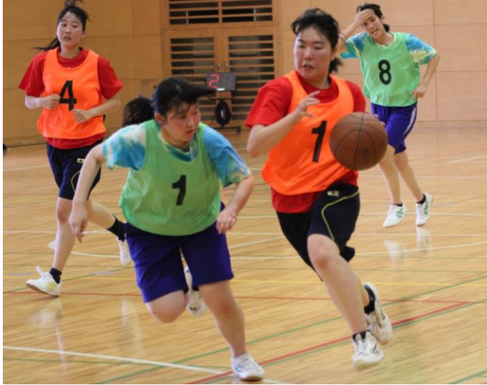
勢いのあるドリブルでボールを繋ぐ1Gと必死に追いかける2I

第1ピリオド開始直後、立って続けに2Iが得点を決めて、試合は2Iのペースに。1Gも果敢に攻めるが、試合中盤で1Gが得点を連取するも、2Iがフリースローなどで追加点を上げ6対11で第1ピリオドが終わった。第2ピリオドも攻勢に出た。2Iは、わずかに1分間に6点を決め、試合は2Iのペースに。1Gも果敢に攻めるが、試合中盤で1Gが得点を連取するも、2Iがフリースローなどで追加点を上げ6対11で第1ピリオドが終わった。第2ピリオドも攻勢に出た。早くすり抜け、点差を縮めていく。2Iもチャンスを作るも、惜しいところでなかなか得点できない。勢いに乗った1Gは逆転を狙い攻め続ける。2Iも負けじとカウンター攻撃を仕掛けるが、得点につなげることができない。ポイント差を詰める1Gを2Iが全力で阻止しようとし、ギリギリの攻防が続く。最終的に20対23で2Iがリードを守りきり、優勝を決めた。