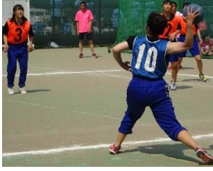
力を込めてボールを投げる3F

2Aが試合開始直後に2点を先取し、試合が始まった。激しい競り合いで接触やフアールも頻りに起こり、両者ともフリースローのチャンスが多い。その後3Fが一本決めるも、2Aはゴール下の攻防戦で優位に立ち続け、16対2で第1ピリオドは終了した。