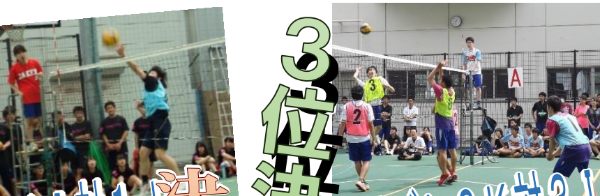
3位決定戦! 女バレー1I対1J 決勝にも劣らぬ熱い戦い

オド、3Fは少しも点を取ろうと必死のプレーを続けるも、2Aの勢いを止めることができない。男バスの決勝は54対19で2Aが勝利した。