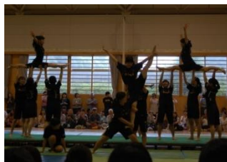
華麗なる体操部の技

第二体育館の体操部によるタンブリングではダイナミックな演技で観客を魅了し、体を何度もひねりながら空中で回転する超大技を見せると観客はどよめいた。終盤には手拍子のなか洗練されたレベルの高