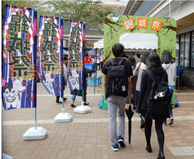
「森」をモチーフにした門をくぐり次々と入場する来場者たち

9月16日(土)、第54回錦城祭が開幕した。初日の来場者数は2400人(本部)。総勢69の企画を楽しむ観客で校内は活気にあふれていた。 (編集部共同取材)