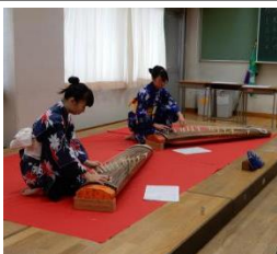
凛とした音色が響く

邦楽同好会の演奏会『錦舞台』は2年前に活動を再開して以来初。1曲目「荒城の月」では箏の凛とした音色が教室を包み込んだ。最後の「デイズ・ツー・メドレー」は初々しい1年生2人による演奏。懐かし 「ラジオ公開生放送の企画を行っている。この企画は初の試みだ。1日2回午前と午後収録を行う。フリートークコーナーと毎回違う先生を招く質問コーナーがある。初回のゲストは放送部顧問で情報科の芦澤先生だった。生徒からの「いつどんな時に笑うの?」という質問に先生は「学校では笑う機会が少ないだけです」と答えるなど生放送は