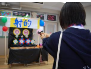
ストレスを打ち抜け!

2Gのクラス企画はストレス発散緑日「華押忍!!」。いくつかのストレス発散コーナーの始めは紙破り。係の生徒が両手でピンと張った紙を、思いっきりパンチするのだ。パンチで一思いに紙を破って、想像以上に快感だ!他にも、ボールの壁投げ、射的コーナーなどさまざまなストレス発散コーナーが盛りだくさんだ。旧校舎四階で体験してみよう。