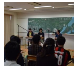
「KBCラジオの時間です」