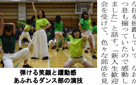
弾ける笑顔と躍動感あふれるダンス部の演技

合唱祭のDVDが完成しました! 価格は1枚500円です(1枚に1学年分の映像が入っています)。購入を希望する方は、新校舎7階にある映画研究部の部室に来るか、映画研究部員にお申し付けください。