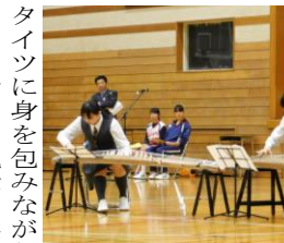
新歓では初めて、繊細で美しい音色を奏でる邦楽同好会

映画研究部は、過去に制作した作品を交えて活動内容を説明した。映像が流れると1年生からは感嘆の声が多く漏れ出る。ワンダーフォーゲル部・スキー同好会では、実際に山に登ったりスキーに行ったりするときの服装に身を包んだ部員が1年生の前に立ちながら活動内容を説明。スクリーンには山からの景色やスキー中の写真が映し出され、臨場感のある紹介となった。