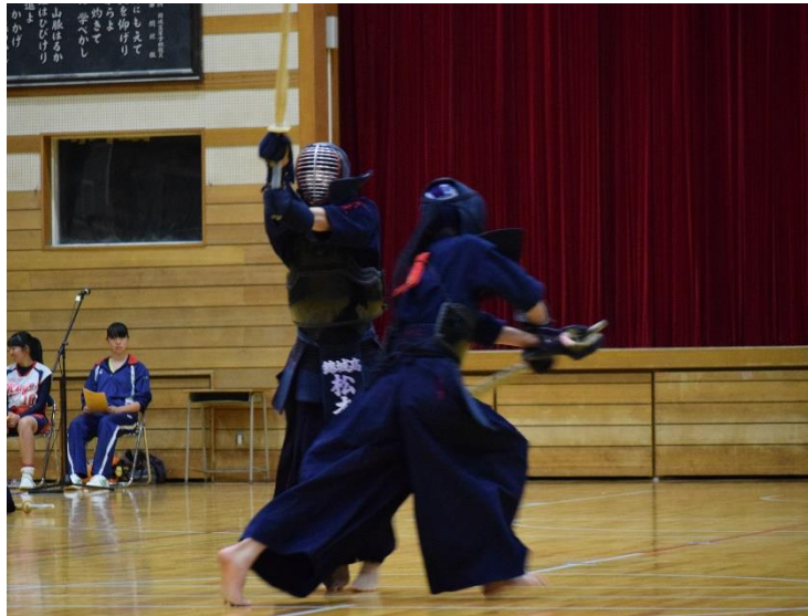
しなやかな動きで面抜き胴を披露する剣道部に会場内の視線は釘付けになる

最初に吹奏楽部と室内楽部、2年生の有志によるハレルヤの合唱があった。吹奏楽部と室内楽部の繊細な演奏に合わせ、有志は英語の歌詞を堂々と歌い上げる。演奏後には自然と拍手が湧き出した。その後、ビデオによって各委員会と一部の部活動の紹介があった。