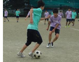
巧みな動きでディフェンスをかかわす

リードを許す1Gだが再び反撃が始まる。ゴール横からの3ポイントを皮切りに連続で決めて10対11と怒濤の大逆転。だが、2Iが大きなプレッシャーの中シュートを決め、逆転勝利した。目を離せない闘いに、会場からは大きな拍手が沸き起こった。