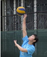
負けてたまるかとサーブを繰り出す

女子バレー 1F対2E 1F対2Eの試合は終始1Fが優勢だった。1Fの5連続サーブエースで幕を開ける。強烈なサーブに2Eも必死に食らいつくが、なかなかラリーに持ちこむことが出来ない。1Fが勢いそのまま15対6で第1セットを取った。応援にも熱が入ってきた第2