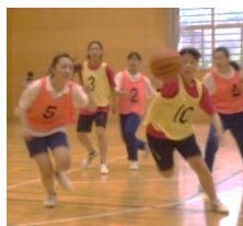
選手への力強いプレス

事勝利した。 女子バスケ 1A対3C 1A対3Cの試合は、1Aが3Cに果敢に攻める姿が目立った。先制点を決めたのは1A。3Cはクラスメイトの大きな声援を受け、負けじと食らいつくが前半は1Aが制した。後半も終始1Aの勢いは止まらず、スリーポイントシュートを次々入れ得点を稼いでいった。3Cは的確なパ