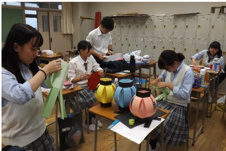
クラス企画の準備をする1F。手作りちょうちんで縁日をカラフルに彩る