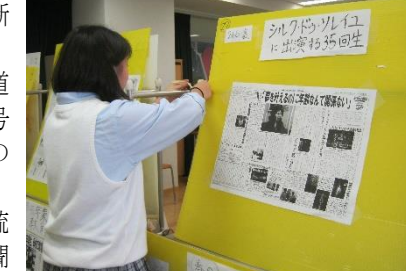
新聞を貼ったボードを会場に設置する編集委員

錦城高校新聞委員会は今年も「錦城高校新聞」バックナンバーの展示を行っています。今年の会場は1号棟(新校舎)4階にある書道室。会場では、2016年6月発行の200号から最新の271号までと、それ以前の新聞の中から選ばれた傑作選がずらりと勢揃い。また、会場内の黒板で新聞ができるまでの流れを知ることができたり、随時会場にいる新聞委員会編集委員と交流したりすることも可能です。錦城新聞の裏話や日頃の活動など編集委員の生の声を聞くチャンスです。ぜひ書道室に足を運んでみてください。