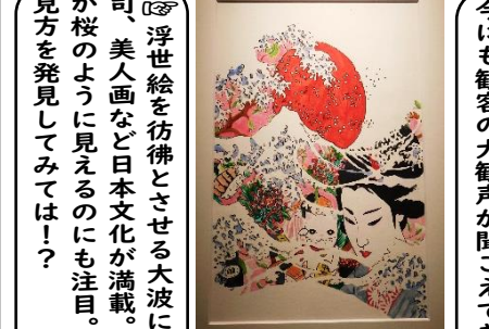
「パラリンアート 世界大会2018」 スペイン賞 Liso(スペイン) 『Sweet Japan』