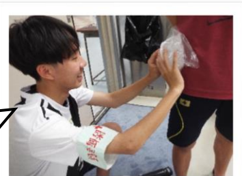
2019年 春季大会 1日目

熱中症予防のためにこまめな水分補給や休息を取り、けが防止のために入念な準備体操を忘れずに!