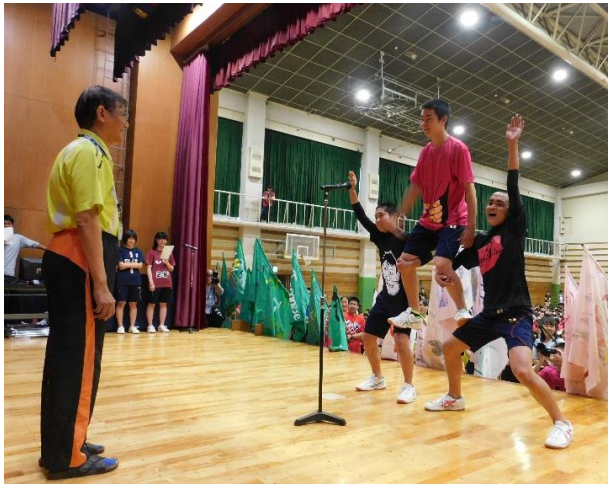
工夫を凝らしたクラス旗を背に愉快的選手宣誓で会場を盛り上げる

熱い歓声の中始まった第1ピリオド。ジャンプボールを取った1Fが一気にゴールを目指すが、すかさず3Hがボールを奪い点を取る。その後、点を重ねる。守備面では3Hの素早い動きが1Fの攻撃を