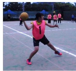
狙いを定めてボールを投げる

第1ピリオドは2Cからの攻撃となり、試合開始後すぐに2Cが先制。1Gもすぐさま反撃し同人数に。その後お互いに1人ずつ当て、どちらも