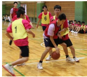
巧みなドリブルでボールを守る

第1ピリオドは1Aの先制から始まり、その後も1Aが順調に点を重ねていく。続く第2ピリオドは開始直後に1Kがスリーポイントシ