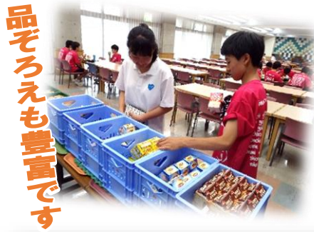
品そろえも豊富です