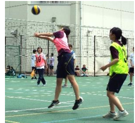
必死にボールに飛びつく3D

第1ピリオドの前半は1H のミスが続く7対2と3Dが リードする。しかし1Hもサ ーブにより大量得点。勢いよ く飛ぶボールをいなさけれ ず、3Dは1Hに9対11まで