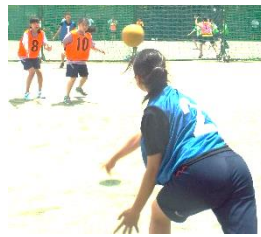
勝利へ向けてボールを投げる

第1セットはジャンプボ ールを取った1Aが先制。素早 いボールを何度も投げる1A に対し、2Bは外野と内野で 高いボールを回しチャンスの 場面で確実に当てるという両 チーム異なる戦術だった。1 Aは何度もボールをキャッチ し粘り強さを見せたが、着実 に相手の数を減らした2Bが 第1セットを制した。