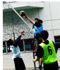
ネット際でのプレーが見られる場面も

戦。1Kは勢いあるドリブル からシュートを決め、3Jは パスをつなげて果敢にゴール に挑む。各チーム得点を重ね て14対6で終了。1Kが優勢 の状態が続いた。 第3ピリオド序盤は開始後 すぐにゴールを決めた3Jの 流れに。一方1Kは相手のデ ィフェンスをかわし、すかさ ずゴールに持ち込み試合の流 れを取り戻す。長いパスを活 用してさらに点を重ね、試合 は19対8で1Kが勝利した。 敗者復活ブロックである1 Dと2Gの試合は、サーブミ スも少なく、お互い巧みなパ ス回しを見せる接戦になっ た。ゲーム開始直後は一進一 退の攻防に。お互い正確なサ ーブを決めあつたが、1Dが 流れをつかみ15対8でリ ードし第1セットを終える。 続く第2セットは、先にサ ーブをした1Dが続けざまに サーブを決め6点先取。一気 に引き離したように見えた が、2Gも負けじとボールを 叩き込み6対6まで追いつい た。試合は接戦を迎える。両チ ームセッターを活用し、激し いラリーが続いた。最終的に 1Dが接戦を制し、15対13で 競り勝った。