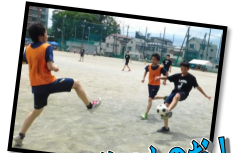
ボールは俺のものだ！