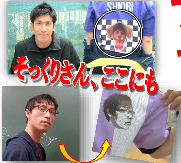
そっくりさん、ここにも