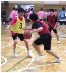
カットインを狙う3J

第1ピリオドは3Jの攻め から始まる。しかし1Kの優 れた守備により試合の流れは 一気に1Kに。6対2で1K が先制した。 第2ピリオドは激しい攻防