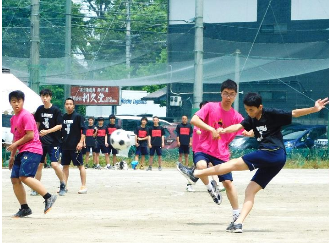
1Cのディフェンスをかわし、前衛にパスを繰り出す3L

握る。次々とゴールを決めたが、多くの好機を活かし、スリ ゴール下での熾烈なボール 2と大差をつけて終えた。 争いが繰り広げられたこの一 第2ピリオドはもつれる展 戦は序盤から1Jが主導権を 開に。2Hが反撃の狼煙をあ 1Jは、第1ピリオドを8対1ポイントシュートを決め る。しかし1Jも負けじとシ ュートを打ち、両チームとも 14対8と得点を重ねた。 第3ピリオドでは1Jが勢 いそのまま5連続でシュート を決める。2Hも最後まで粘 つたが、1Jが22対8と、次 の戦いに駒を進めた。