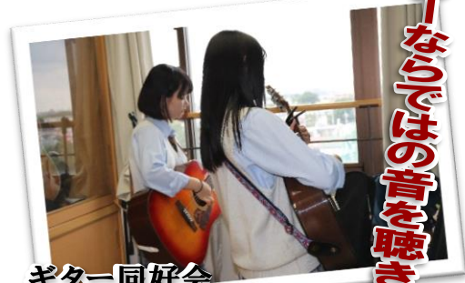
ギター同好会 4階にて 弾き語り、演奏会