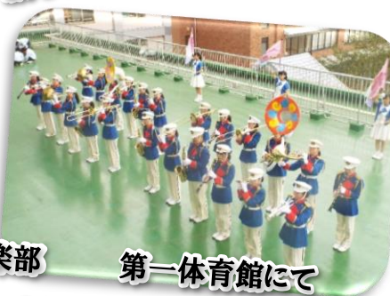
吹奏楽部 第一体育館にて 14日 10:00~、15日13:30~