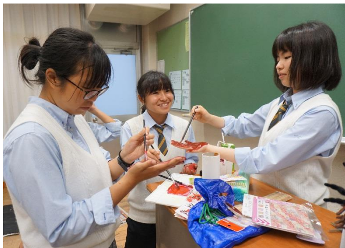
「謎解きはお化けのあとで」で使用する血の手形の演出を和気あいあいと進める1Gの生徒

1Gのクラス企画は「謎解きお化けのあとで」という謎解きを取り入れたお化け屋敷だ。