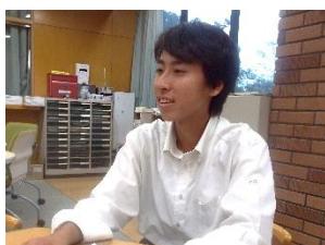
「司会者による企画も見所です」