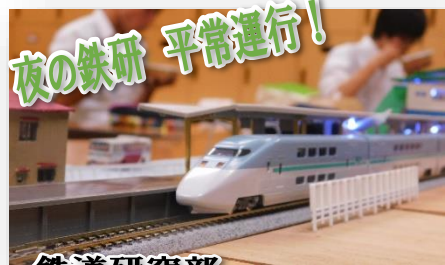
夜の鉄研 平常運行! 鉄道研究部 新校舎 3階で展示中