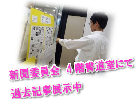
新聞委員会 4階書道室にて 過去記事展示中