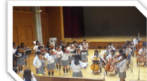
室内楽部 多目的ホールにて 14日 12:50~