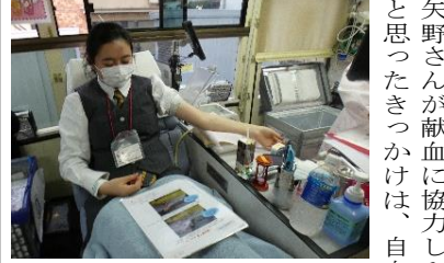
初の献血に緊張した様子

され、多くの生徒が参加した。今回のような臨時設置の主な理由は、より生徒の身近なところに設置することで献血に参加しにくいと感じている人に少しでも多くのきっかけを作ってもらいたいからだそう。また、錦城高校の近くだと吉祥寺駅、立川駅などには献血ルームが常設されている。もし訪れる機会があったら献血に協力してみよう