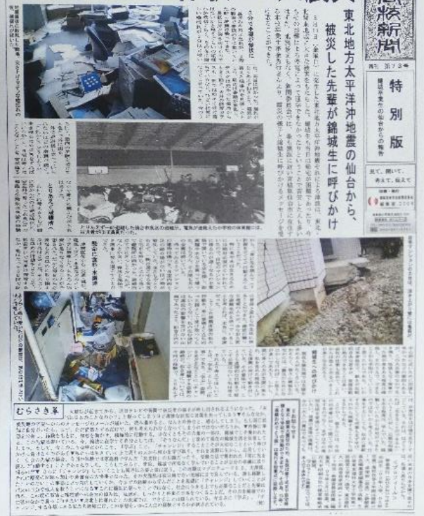
大きな写真で震災の悲惨さが伝わってくる

12年経つ東日本大震災の恐ろしさを思い出してほしいからだ。あの震災を再認識し、今後10年以内に70%の確率で起こるといわれている首都直下地震について考える機会としてくれたらうれしい。2つ目は新聞発行の早さに驚いたからだ。被災地から震災の状態を伝えたいと思う錦城高校新聞委員会OBの方の行動で震災からわずか12日での速報号発行ということに同じ新聞委員会としてとても感動した。私も先輩の「伝えたい」という信念を見習ってこれからも錦城高校新聞を作っていきたいと思う。(月)