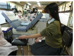
指先で血液の状態をチェック

1月14日(土)に錦城高校近くのホームセンターで献血が行われた。献血は医療行為のため、献血を行う人は厳しい基準をクリアしている必要がある。東京都赤十字血液センタースタッフの方に献血をするために必要なことについてお話を聞くと「そのすべては献血をする人や受け取る人の安全を守るために設けられている基準です」と説明した。