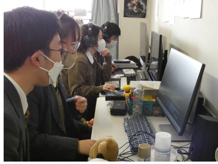
次作に向けて真剣に作業する映画研究部の部員

映画研究部が、11月23日(水)に行われた第45回東京都高等学校文化祭放送部門のビデオメッセージ部門において優勝という成績を収めた。